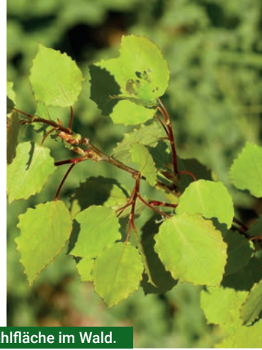
Ebereschen, Weiden und Aspen besiedeln jede Kahlfläche im Wald.

Dabei wäre milder Humus notwendig, um Wasser zu speichern. Das Fehlen von Ebereschen, Salweiden und Aspen auf den Flächen hat noch weitere negative Auswirkungen auf die Wiederbewaldung. Wichtige Funktionen dieser Vorwaldarten sind neben der Bodenverbesserung der Schutz des Bodens und der nachwachsenden Bäumchen vor Spätfrösten und Hitze. Die „Hauptbaumarten“ – im Sinne eines künftigen, klimastabilen Waldes – können sich oft erst im Schutz dieser Vorwaldbäumchen etablieren.