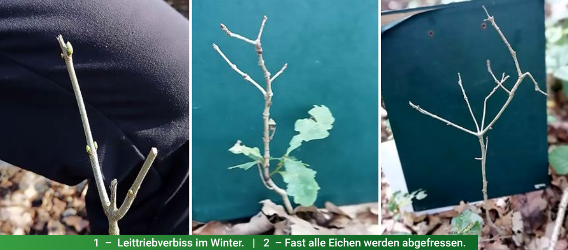
1 – Leittriebverbiss im Winter. | 2 – Fast alle Eichen werden abgefressen.