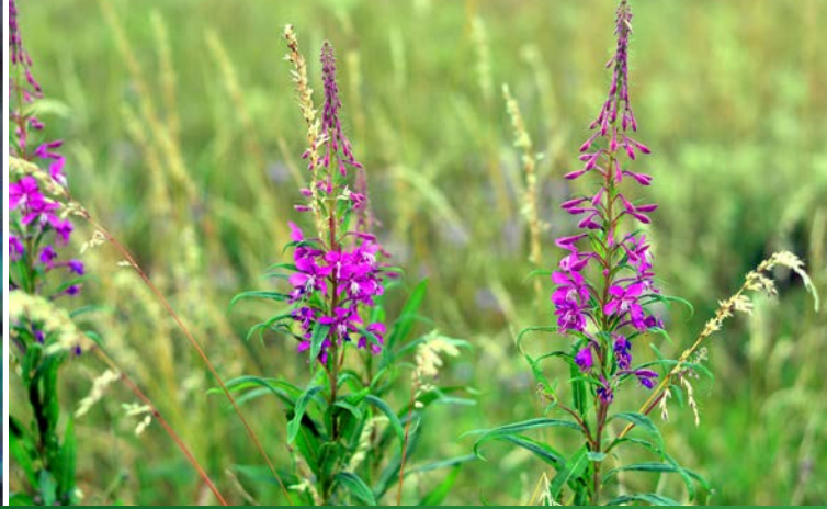
...und Eiche. Auch das Schmalblättrige Weidenröschen äst das Reh gern.

Neben den materiellen Schäden verursacht massiver Verbiss auch ökologische Folgeschäden. Durch die Überweidung wachsen am Waldboden oft nur ökologisch wenig wertvolle Allerwelts-Gräser. Seltene und in ihrem Bestand gefährdete krautige Arten werden dagegen selektiert, das heißt, es findet eine Verschiebung des Artenspektrums statt. Wichtige Waldarten wie das Schmalblättrige Weidenröschen werden fast komplett von den Rehen gefressen. Eigentlich würde sich diese Art auf Kahlflecken rasch massenhaft ausbreiten. Aufgrund des Fraßdruckes kommen außerhalb von rehdichten Gattern keine Weidenröschen zur Blüte. Damit fällt diese Art als Wirtspflanze für Waldinsekten aus.