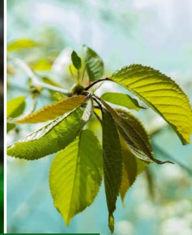
Bevorzugt vom Rehwild: Bergahorn, Kirsche...