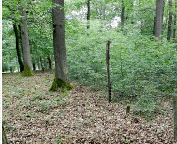
5 – Königsforst im Mai 2017. | 6 – Hetzingen / Nationalpark Eifel 2019.