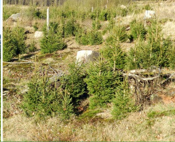
3 – Kyrillflächen neun Jahre nach dem Orkan.